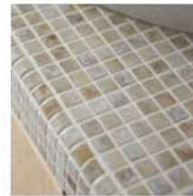
タイルカウンター(ミックスブルー)