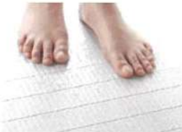
フラッグストーンフロア