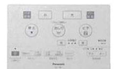
ワイヤレスリモコン