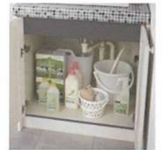
両開き仕様キャビネット