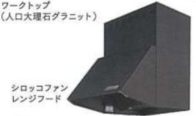
シロッコファン レンジフード